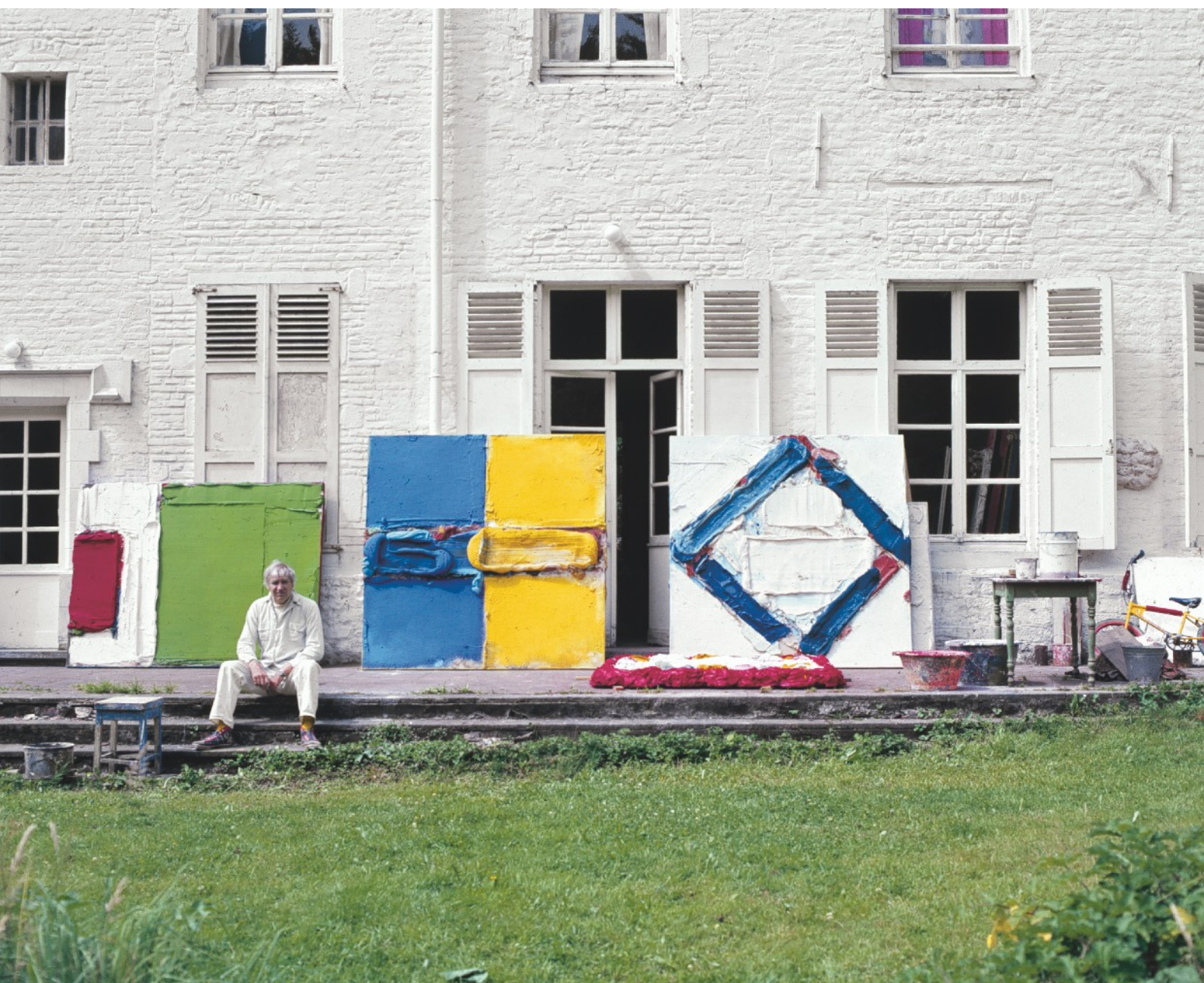
Manoir d'Ohain, 1965/66