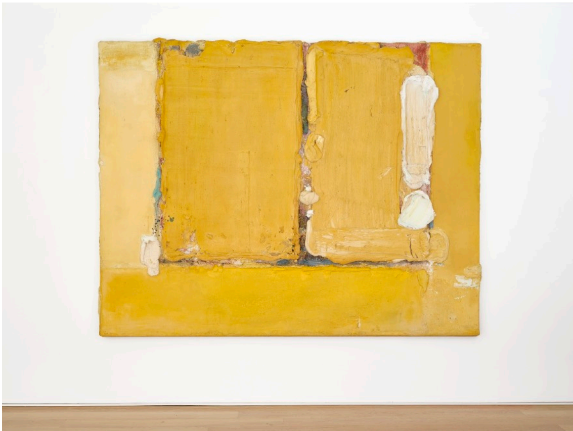
ZONZUCHT/ Januari 1965 205 x 265 cm

Mixed media on canvas, mounted on wood Signed on the side 'Bogart 65' and titled, dated and signed on the verso