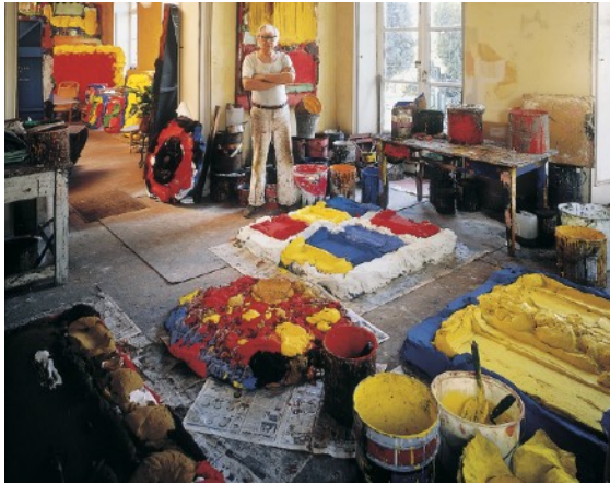
Bram Bogart in atelier